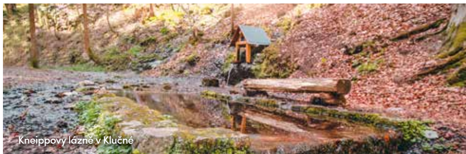
Kneippovy lázně v Klučné