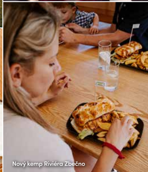
Nový kemp Riviéra Zbečno