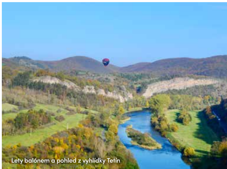
Lety balóne m a pohled z vyhlídky Tetín