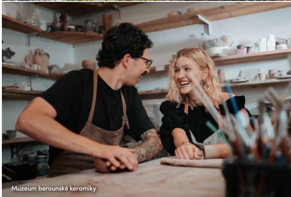
Muzeum berounské keramiky