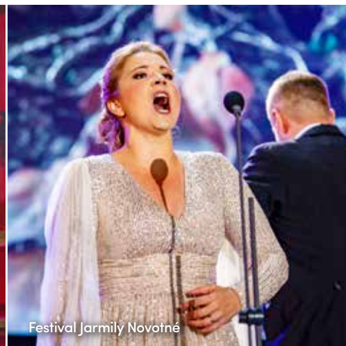
Festival Jarmily Novotné