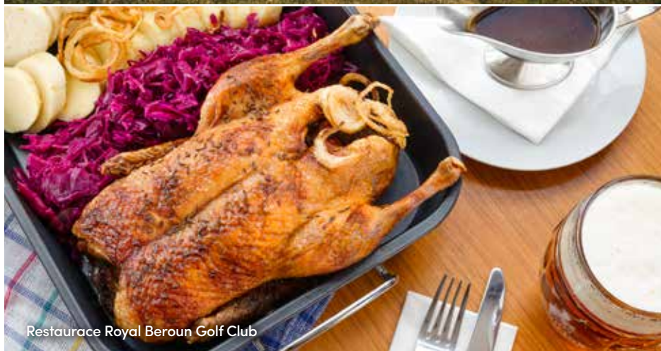
Restaurace Royal Beroun Golf Club