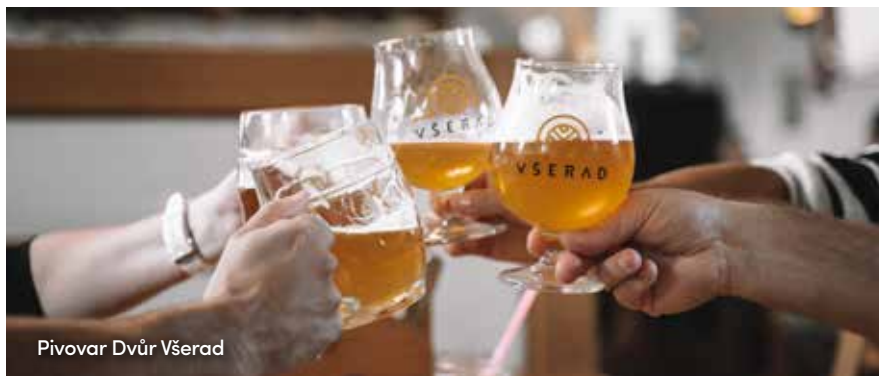
Pivovar Dvůr Všerad