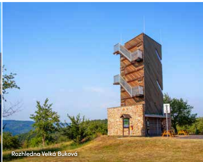
Rozhledna Velká Buková