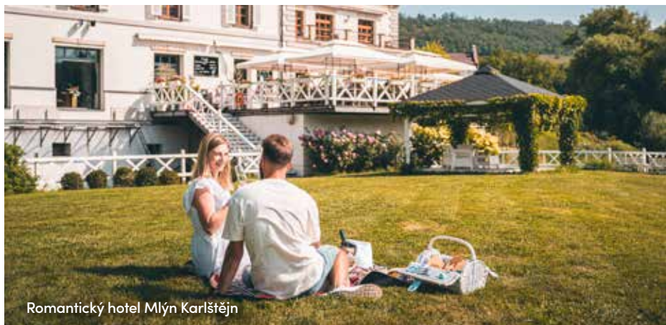
Romantický hotel Mlýn Karlštejn