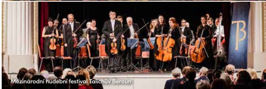
Mezinárodní hudební festival Talichův Beroun