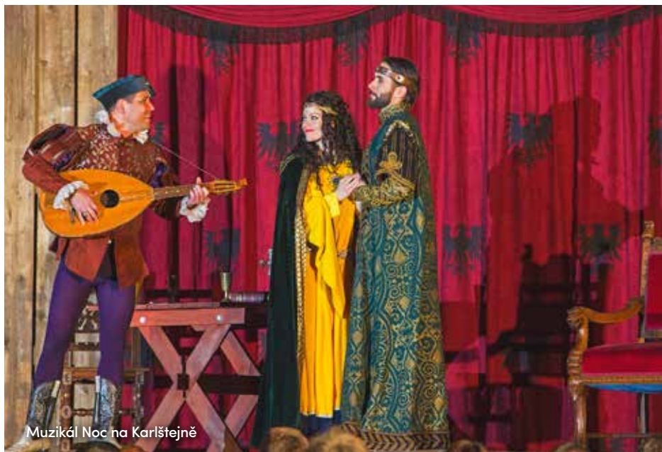
Muzikál Noc na Karlštejně