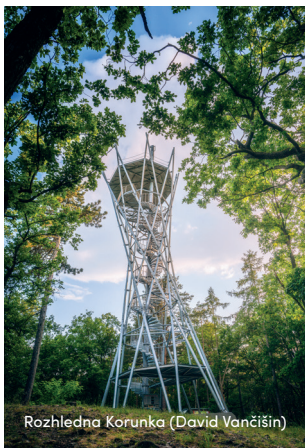
Rozhledna Korunka (David Vančíšin)